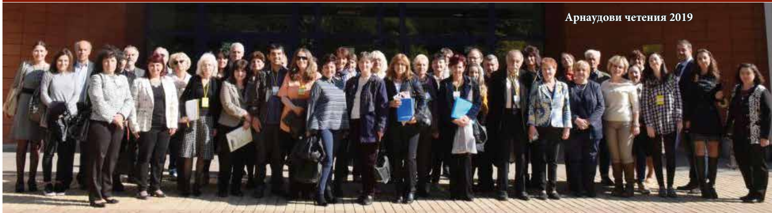
Арнаудови четения 2019