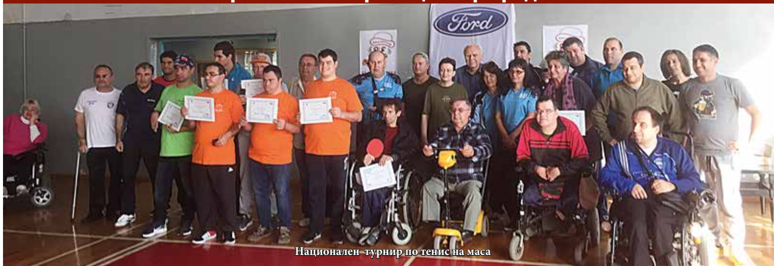
Национален турнир по тенис на маса