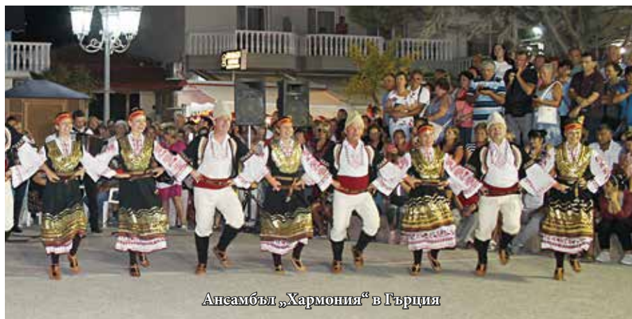
Ансамбъл „Хармония“ в Гърция