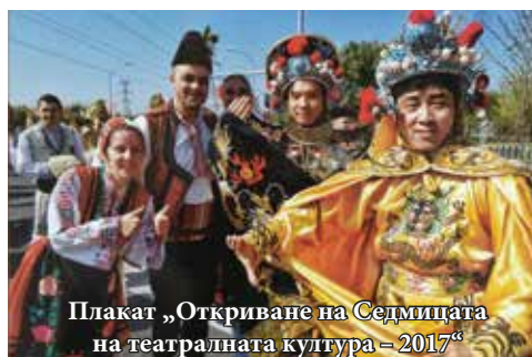
Плакат „Откриване на Седмицата на театралната култура – 2017“