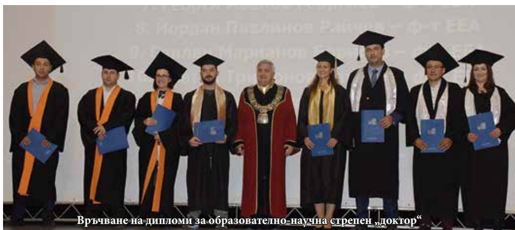
Връчване на дипломи за образователно-научна степен „доктор“