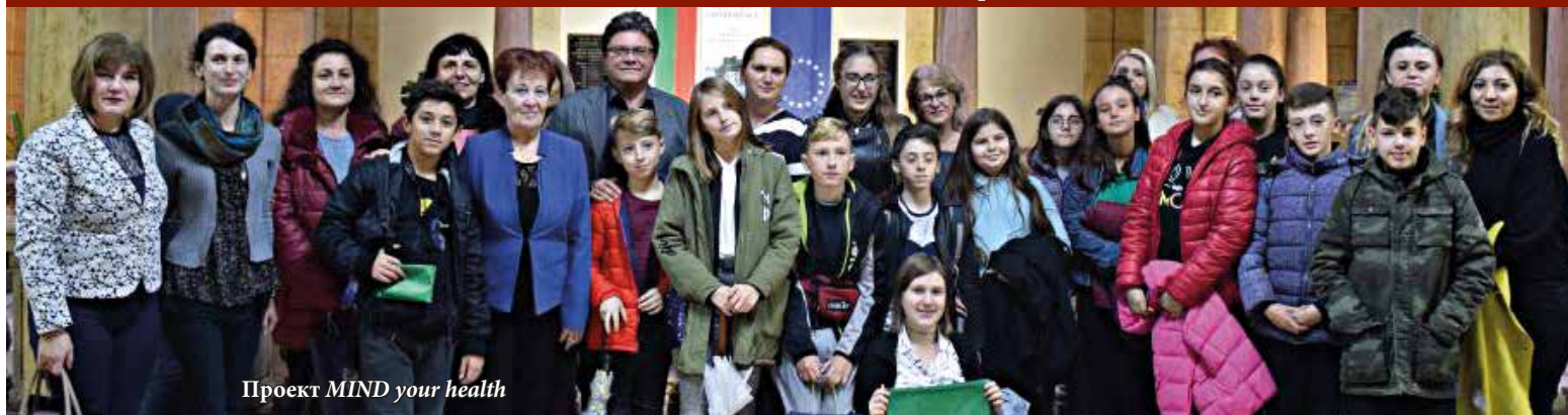
Проект MIND your health