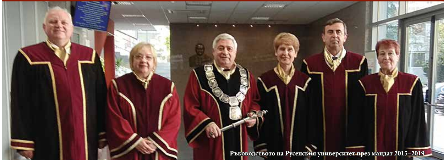
Ръководството на Русенския университет през мандат 2015–2019

Дирекция „Нуждестранни студенти“ – 65 години. Отличени бяха пенсионирани преподаватели във връзка с навършени годишнини, както и за принос в развитието на Русенския университет.