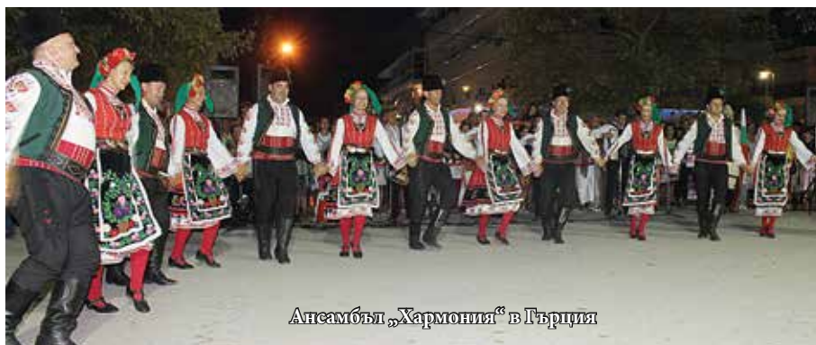
Ансамбъл „Хармония“ в Гърция

Един от Културните клубове на Русенския университет, който не спира дейността си вече 49 години, е фолклорният ансамбъл „Хармония“. Участниците в него са като ято птици, които знаят винаги полета си и се появяват точно и сигурно където и когато трябва. В началото на всяка учебна година в него се вливат нови попълнения, други си отиват, започвайки дипломирана работа по родните си места или в други градове. Но основната част от ятото са ония стари, тренирани „птици“, които водят строя, които