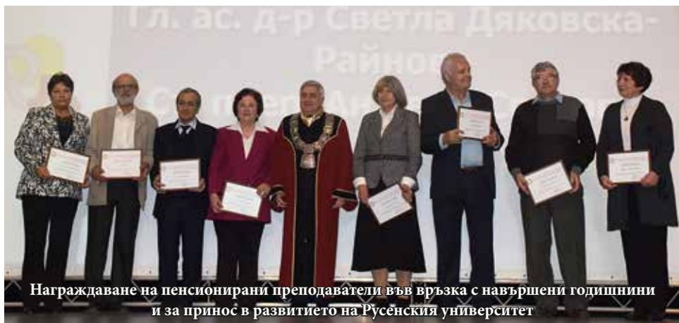
Награждаване на пенсионирани преподаватели във връзка с навършени годишнини и за принос в развитието на Русенския университет

Факултети и дирекции получиха дипломи и плакети по случай годишнини от основаването им, както и за принос в развитието на Русенския университет: Аграрно-индустриалният факултет – 65 години; Факултет „Електротехника, електроника и автоматика“ – 45 години; Факултет „Природни науки и образование“ – 25 години; Факултетът „Бизнес и мениджмънт“ – 25 години; Факултет „Обществено здраве“ – 10 години;