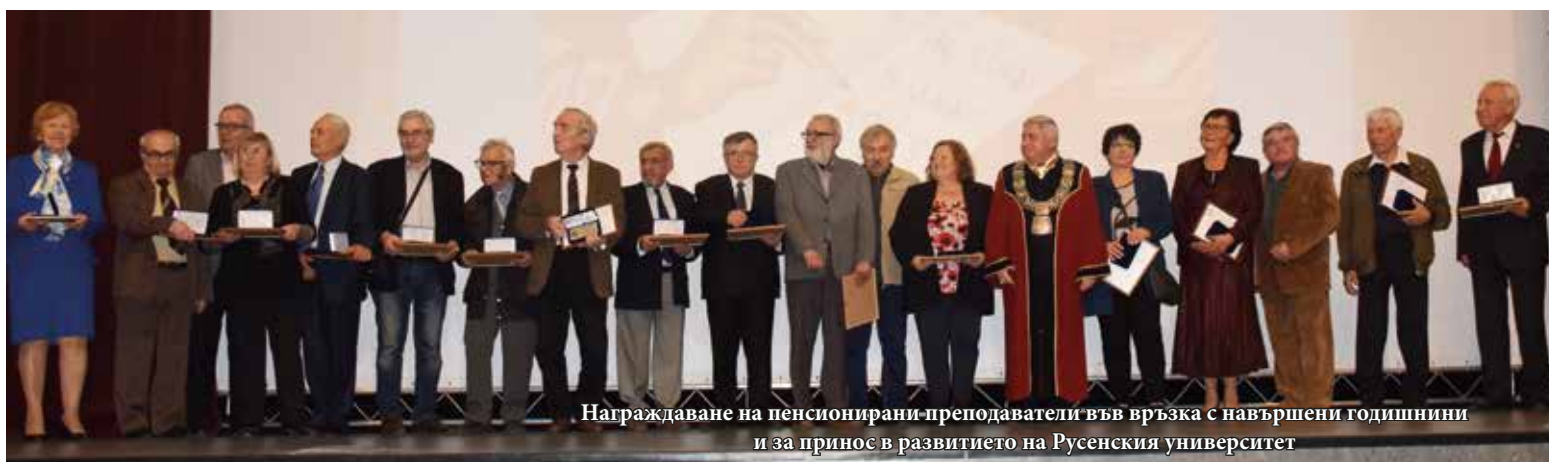
Награждаване на пенсионирани преподаватели във връзка с навършени годишнини и за принос в развитието на Русенския университет