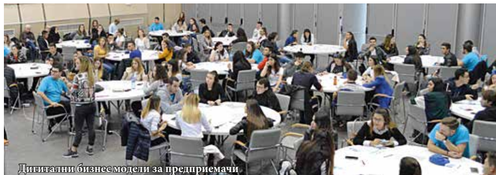
Дигитални бизнес модели за предприемачи

Иновативно състезание „Дигитални бизнес модели за предприемачи“ се проведе на 8 ноември 2019 г. с участието на 84 ученици от училища от областите Русе, Разград и Силистра, заедно с 19 студенти от Бизнес факултета и 8 представители на русенски