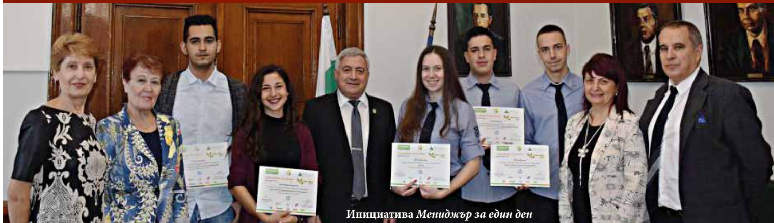
Инициатива Мениджър за един ден