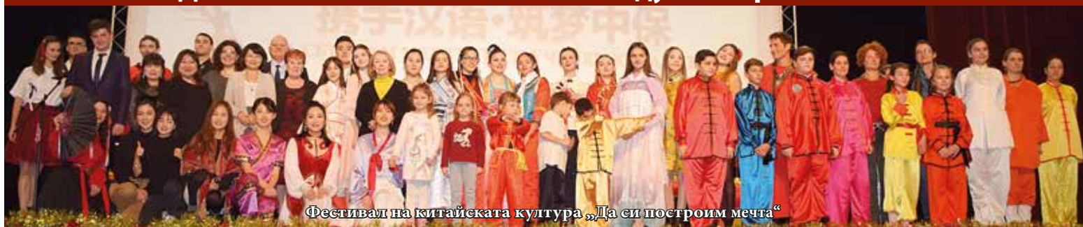
Фестивал на китайската култура „Да си построим мечта“