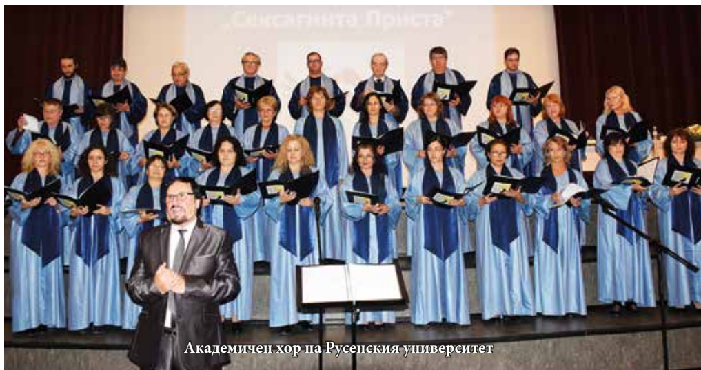
Академичен хор на Русенския университет