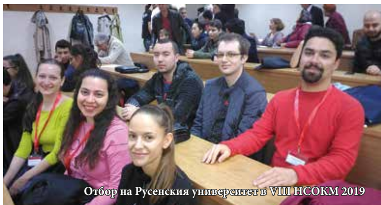
Отбор на Русенския университет в VIII НСОКМ 2019

В олимпиадата участваха 63 студенти, обучаващи се в бакалавърска или магистърска степен от следните университети: Русенски университет „Ангел Кънчев“, Софийски университет „Св. Климент Охридски“, Пловдивски университет „Паисий Хилендарски“, Великотърновски университет „Св. св. Кирил и Методий“, Технически университет – София, Технически университет – Варна, Химико-технологичен университет – София, Лесотехнически университет – София, Висше военноморско училище – Варна, Американски университет в България – Благоевград.