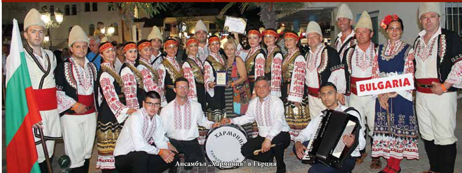
Ансамбъл „Хармония“ в Гърция