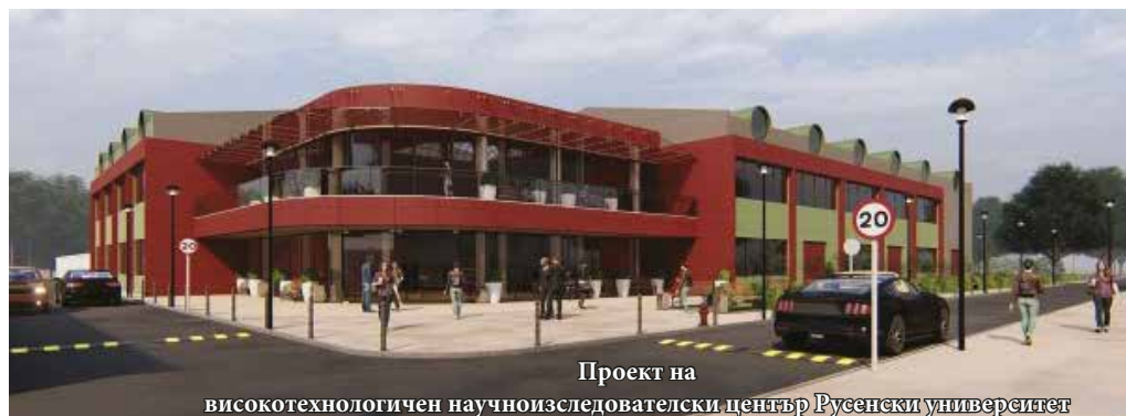
Проект на високотехнологичен научноизследователски център Русенски университет